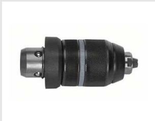
Artikel code 054288 WERKTUIGHOUDER DRIETANDS (SNELSPANNER)