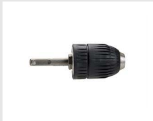
Artikel code 054348 SNELSPAN BOORKOP VOOR SDS+ BOORHAMER