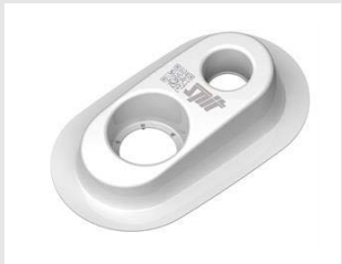
Artikel code 054117 DUSTER PRO STOF AFZUIGINGSADAPTER (10 ST)